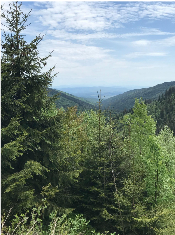
Útközben a Hargitára