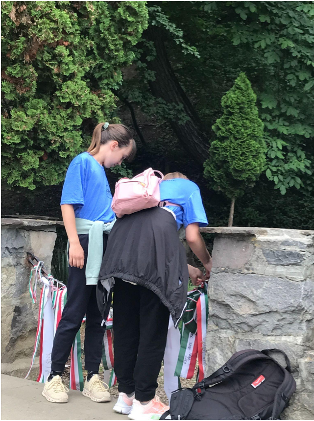
Elhelyeztük a koszorúnkat a síron