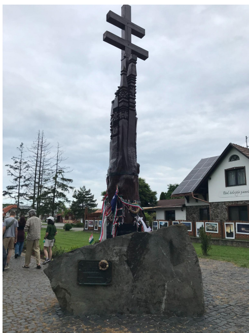
A trianoni békediktátumra emlékeztünk