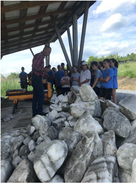
A sóbánya után egy helyi sófeldolgozó üzemet is meglátogattunk.

Utána Korondon álltunk meg, ahol a gyerekek bepillantást nyertek a fazekasok munkájába és ajándéktárgyakat is vásárolhattak.