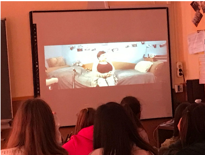
“Törpének lenni, egy óriásokkal teli világban” című film megtekintése