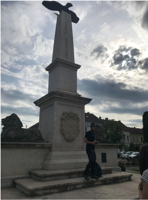
Turulmadaras milleniumi emlékmű