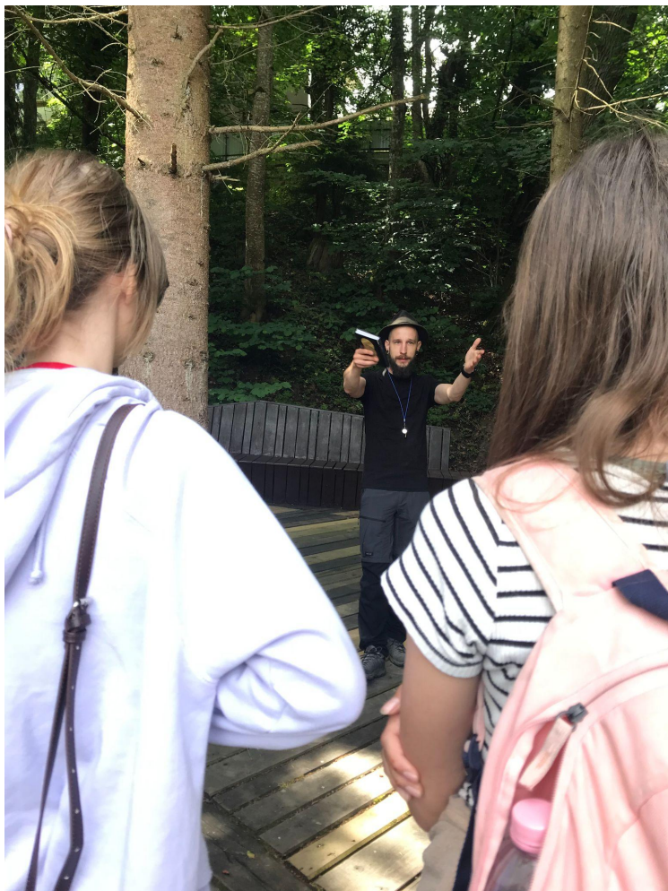
Kelemen Hunor az elhivatott idegenvezető

sókristályokat, borsós felszínű sókarfiolokat láthattunk Végigsétáltunk a város főutcáján, ahol láthattuk a település rendezettségét, virágos portáit.