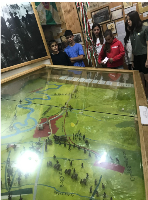
A segesvári csata makettjénél

A múzeumi látogatás után Segesvár várfalakkal körülvett történelmi városközpontját ismertük meg, idegenvezető segítségével. Megnéztük az óratornyot, a középkori szász építészet remekeit, Petőfi Sándor szobrát. Ismerkedtünk az erdélyi szászok világával.