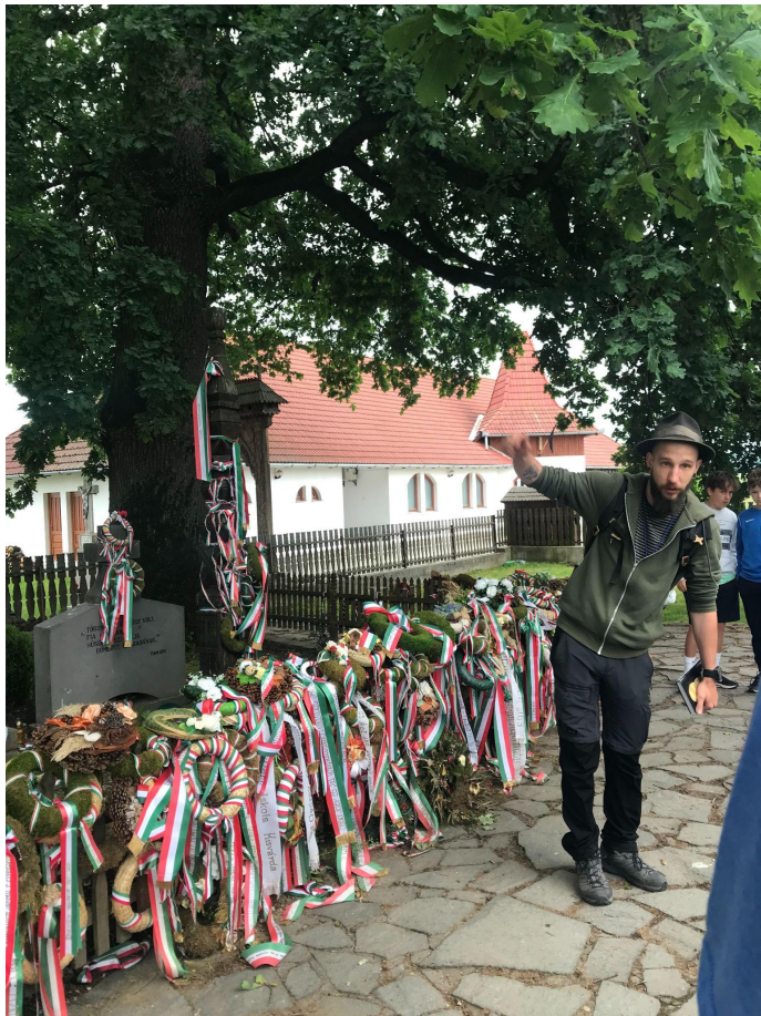
Megkoszorúztuk Tamási Áron sírját

Ismét korán indultunk! Reggel felkerestük és megkoszorúztuk Tamási Áron sírját, melyet Szervátiusz Jenő faragott, mellette megnéztük a Trianoni emlékművet, ahol a trianoni szerződés aláírására emlékeztünk.