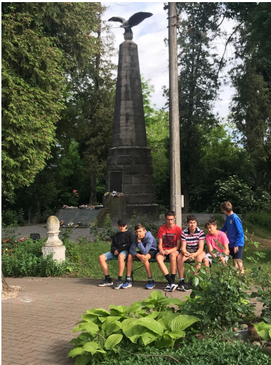
A Petőfi Múzeumban

Reggel a fehéregyházi Petőfi-múzeumot látogattuk meg, ahol érzékletes előadást hallgattunk tárlatvezetéssel.