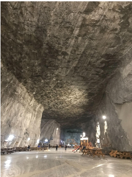
A parajdi sóbánya

Szováta után Parajd volt utazásunk következő állomása, ahol felkerestük a 80-100m mélységben található sóbányát, ahol templom, múzeum, játszótér, is található. Az itt eltöltött idő kedvező hatással volt tüdőnkre, egészségünkre!