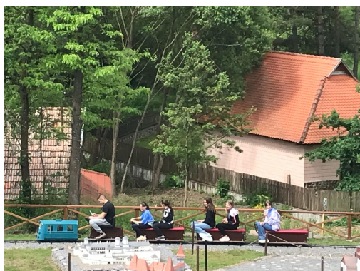
Kisvonatozás a Mini Erdély parkban

Utunkat Szejkefürdő felé vettük, ahol a Mini Erdély parkban megnéztük Erdély nevezetességeinek élethű, kicsinyített reprodukcióit.