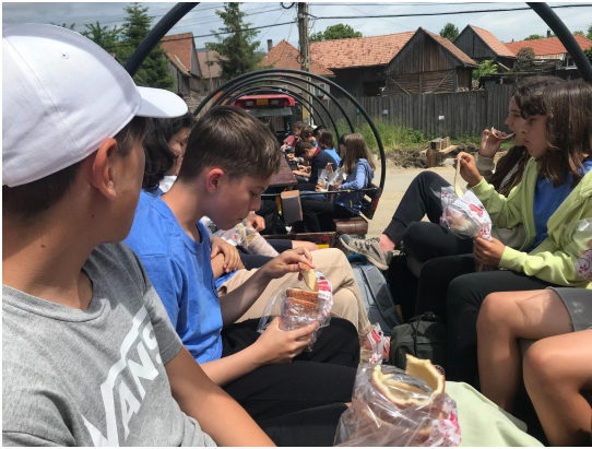
Traktorral és kürtőskaláccsal a Hargitára

Szentegyháza következett utunk során, a hol a helyi asszonyok finom, frissen sült kürtőskalácsait majszolva traktorral meghódítottuk a Madarasi Hargitát.