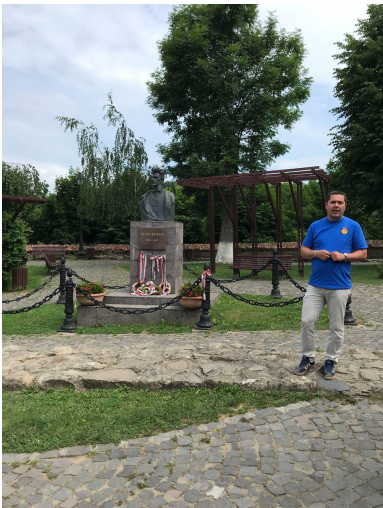
Segesvár Petőfi szobor

Az összetartozás élményét több szinten is megélve, sok szép élménnyel, tudással a tarsolyunkban, fáradtan bár, de jókedvvel értünk haza késő este.