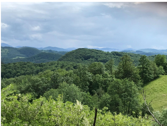
A Király-hágói panoráma