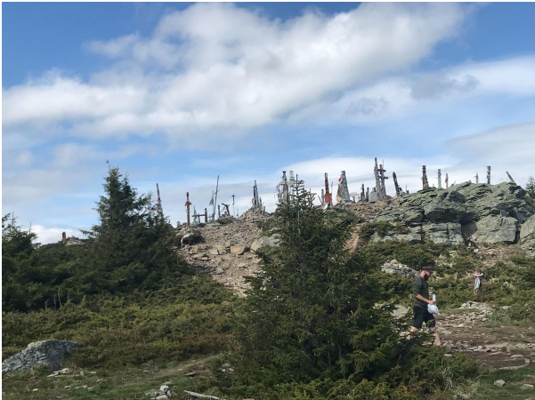
A Madarasi Hargitán-felejthetetlen élmény

Este élményekkel teli érkeztünk vissza a szállásra, ahol ismét bőséges volt a vacsora.