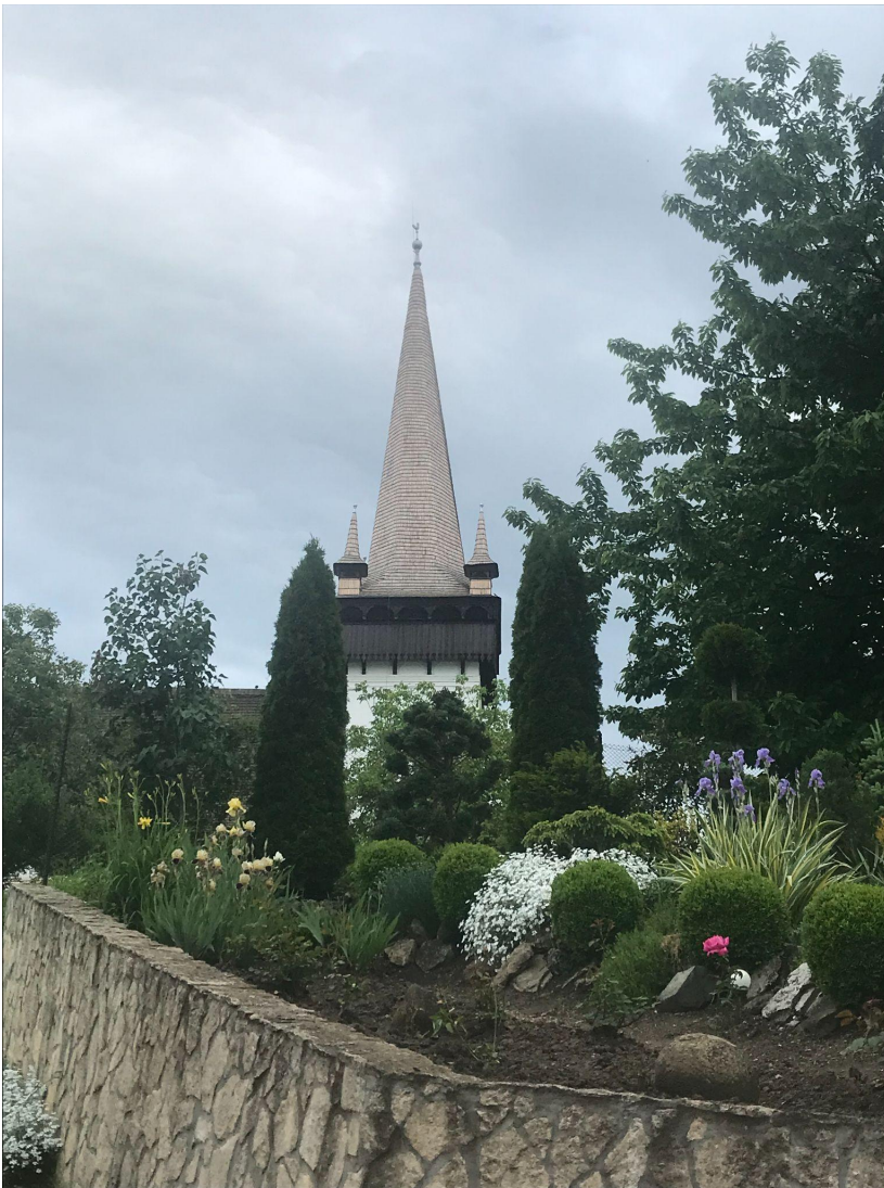
A Körösfői református templom