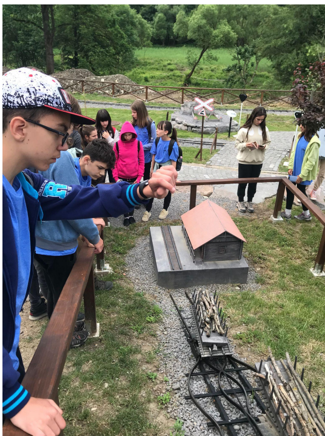
Mini Erdély parkban