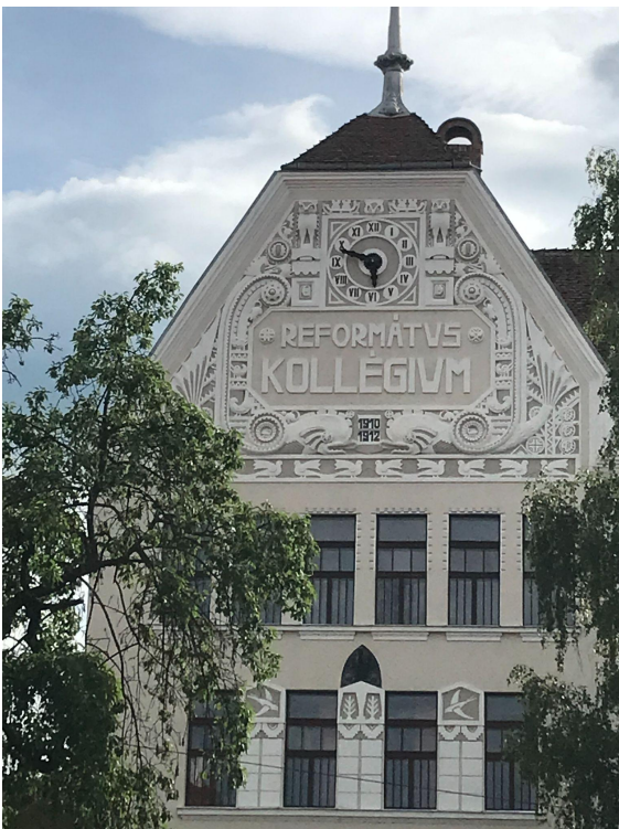
A székelyudvarhelyi-felújított- református kollégium

A nap utolsó állomása Székelyudvarhely a székely főváros volt, ahol a főtéren láthatjuk Orbán Balázs szobrát és a turulmadaras millenniumi emlékművet és a szoborparkot. Kis szabadidőnkben bebarangolhattuk a belvárost.